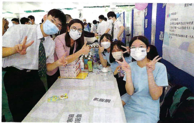
毒品調查科總警司吳穎詩(左二)出席禁毒領袖學院活動