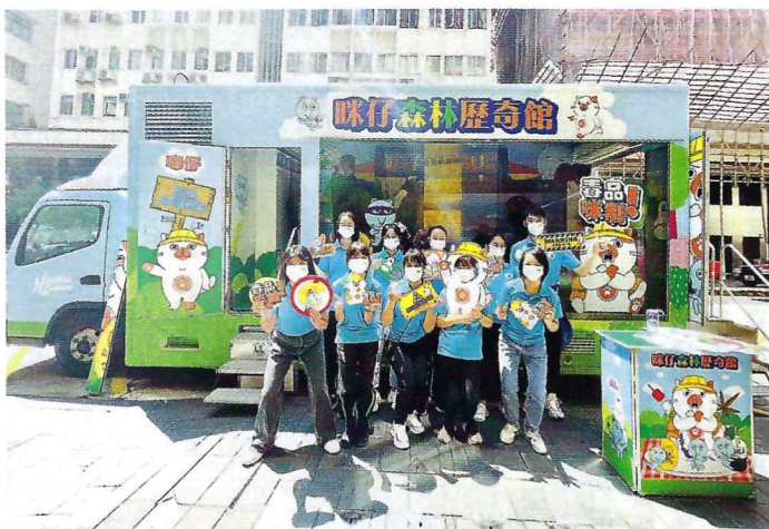
■很多青少年參加禁毒宣傳

禁毒工作日趨多元化，憑藉香港警務處人員鍥而不捨的努力，執法人員克服了種種的難關，不但在檢獲毒品數字有所提升，搗破多個犯罪集團的運輸物流鏈，亦在社會不同層面宣傳禁毒工作。面對不斷轉變的犯罪環境，執法部門必定要以創新思維迎難而上，才能有效提升禁毒宣傳，務求全香港市民遠離毒品的禍害，為香港的繁榮和穩定製造最鞏固的根基。