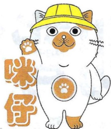
■今年增設的吉祥物「咪仔」

的困難及抵抗各種誘惑，毒品調查科於二零二一年成立「禁毒領袖學院」，於全港挑選八十名中學生及二十名大學生成為學員，學員分成二十小組，每組獲配對一名專業顧問作小組導師。學院會為學員提供系統化的禁毒知識及領袖才能訓練，激發學員的社會責任感，並培訓學員成為具創意及前瞻性的青年禁毒領袖。