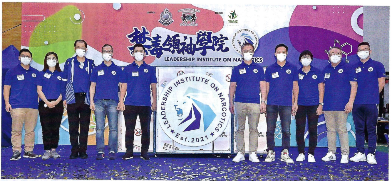
■ 禁毒領袖學院於今年六月舉行啓動禮

新冠疫情肆虐全球兩年多，為販毒模式帶來了巨大轉變。販毒集團不能使用人體運毒及隨身行李運毒，並主要依賴空運及海運方式把毒品藏在郵包和貨櫃內運送出境。此轉變導致販毒集團從螞蟻搬家的模式轉換至以大型貨運將毒品販運入境，警方特別成立禁毒領袖學院，在青年群體中加強抗毒意識。