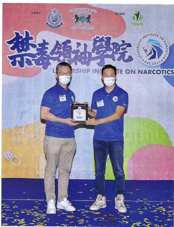
香港警務處處長蕭澤頤(左)頒發委任狀予澳至尊集團主席蔡志輝(右)出任禁毒領袖學院執行委員會首席會長。

得兩倍增幅, 可卡因亦錄得超過百分之五十增幅。由於現時不少外地司法管轄區對管制作用製造冰毒的化學原料較為寬鬆, 不少跨國販毒集團趁機利用這個漏洞, 擴大製作冰毒的規模。而涉及可卡因檢獲量的上升, 則反映出製作相關毒品的數量有上升的趨勢以及各國執法機關(尤其是南美執法機關)執法效率的提高。但另一方面, 因部分司法管轄區將非醫療用大麻合法化, 令到北美地區的大麻檢獲量錄得百分之三十一的跌幅。同時, 精神藥物(包括氯胺酮)的檢獲數量亦錄得大幅減少(下跌百分之五十)。